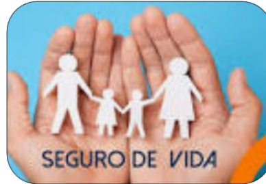
Seguro de vida