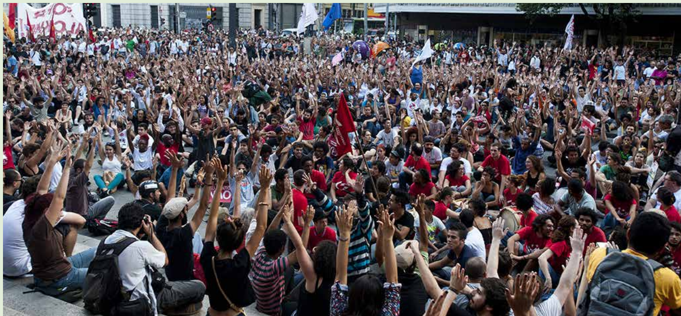
Ato contra o aumento das passagens em São Paulo reúne cerca de 30 mil pessoas.

Desde o início de janeiro as tarifas das linhas municipais da maioria das cidades grande São Paulo tiveram reajuste. As passagens passaram de R$ 3,00 para R$ 3,50, mas há linhas que ficaram muito mais caras, como é o caso da tarifa das linhas da METRA, feitas por trólebus, que passaram a custar R$ 3,70. Agora, para se locomover, a pessoa paga no mínimo R$ 7,00 por dia para sair e voltar para casa. Esse aumento vem junto com o reajuste geral dos preços dos serviços (como conta de luz) e corrosão dos salários pela inflação.